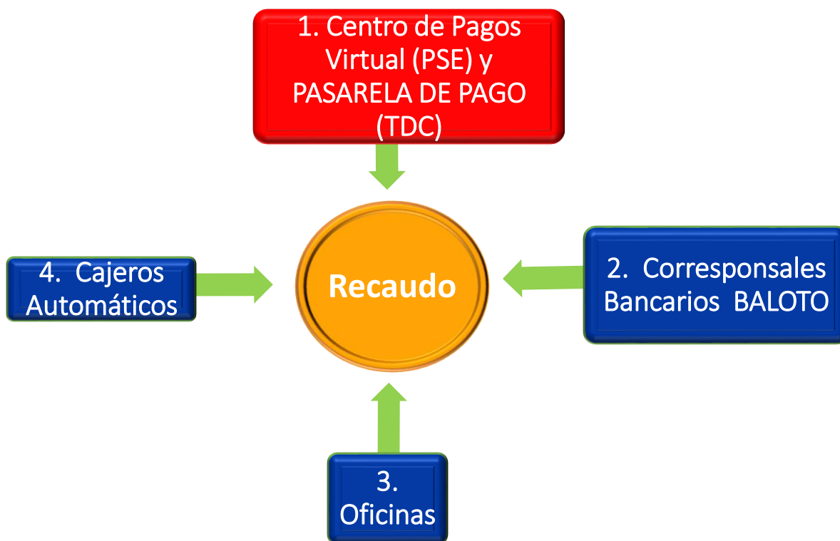
Canales de recaudo RedCOLSI